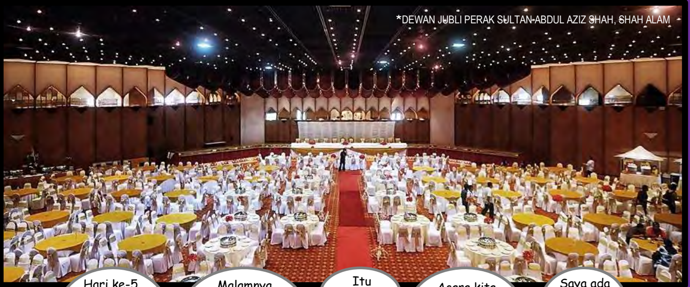
*DEWAN JUBLI PERAK SULTAN-ABDUL AZIZ SHAH, SHAH ALAM

Hari ke-5.. KARNIVAL MUZIUM dibuka seperti biasa..