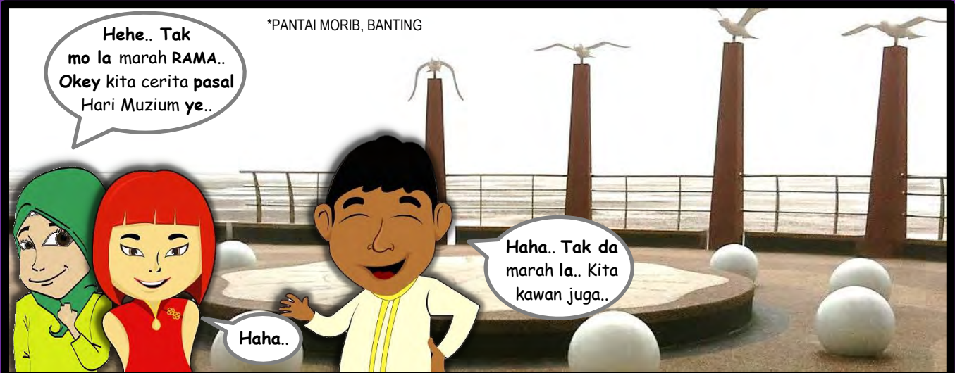
*PANTAI MORIB, BANTING

Hehe.. Tak mo la marah RAMA.. Okey kita cerita pasal Hari Muzium ye..