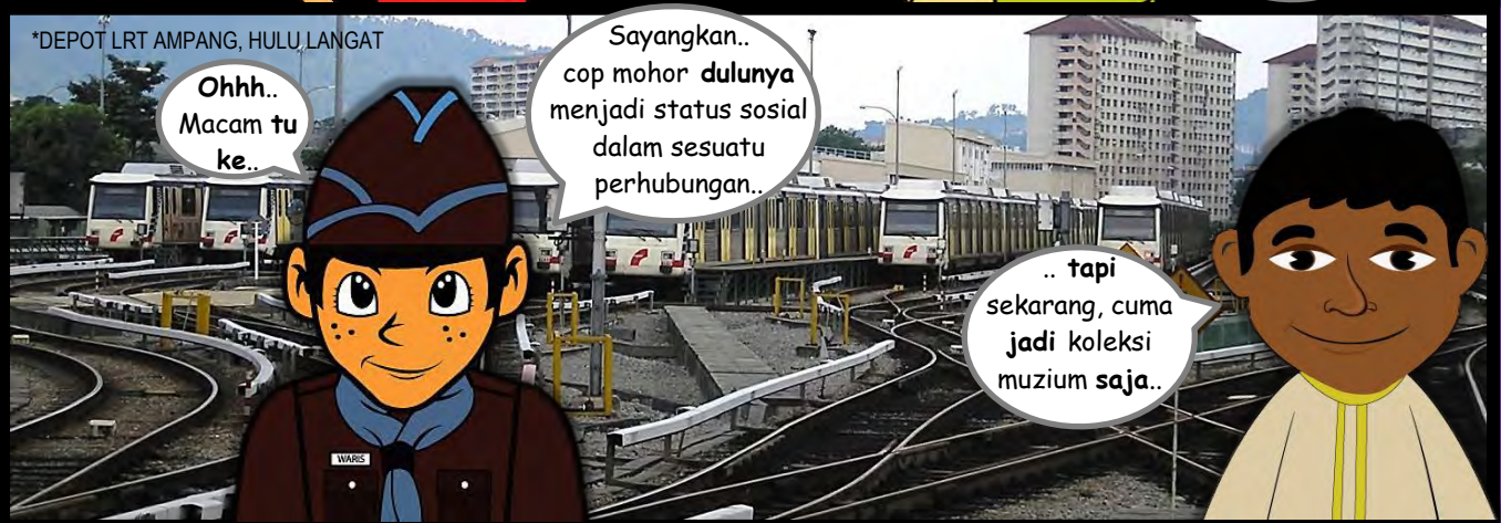
*DEPOT LRT AMPANG, HULU, LANGAT

.. dan huruf jawi sebagai lambang Tradisi ilmu..