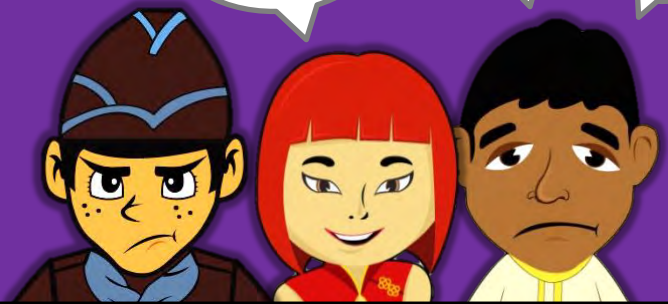
*PEJABAT SETIAUSAHA KERAJAAN NEGERI SELANGOR, SHAH ALAM