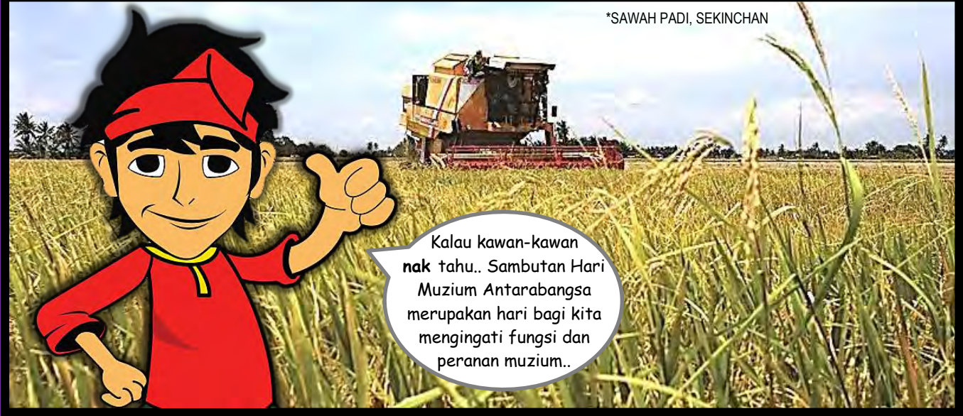
*SAWAH PADI, SEKINCHAN

Haha.. Tak da marah la.. Kita kawan juga..