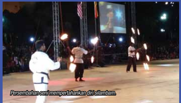
Persembahan seni mempertahankan diri silambam.

Antara aktiviti yang berlangsung ialah persembahan seni mempertahankan diri termasuk pertubuhan seni Silat Lincah Malaysia, Kelab Wushu dan Persatuan Silambam. Seterusnya, Kumpulan Kesenian PADAT mempersembahkan tarian yang berkonsepkan perpaduan nasional. Hari kemerdekaan adalah tidak lengkap tanpa acara perarakan masuk kontinjen-kontinjen yang terdiri daripada sekolah-sekolah, intitusi pengajian tinggi dan badan kerajaan menuju ke kawasan padang. Acara gilang-gemilang ini digamatkan lagi dengan persembahan pancaragam sekolah, seterusnya bacaan ikrar Rukun Negara dan laungan kemerdekaan sebanyak tujuh kali. Majlis diakhiri dengan nyanyian lagu "Tanggal 31 Ogos" oleh para hadirin.