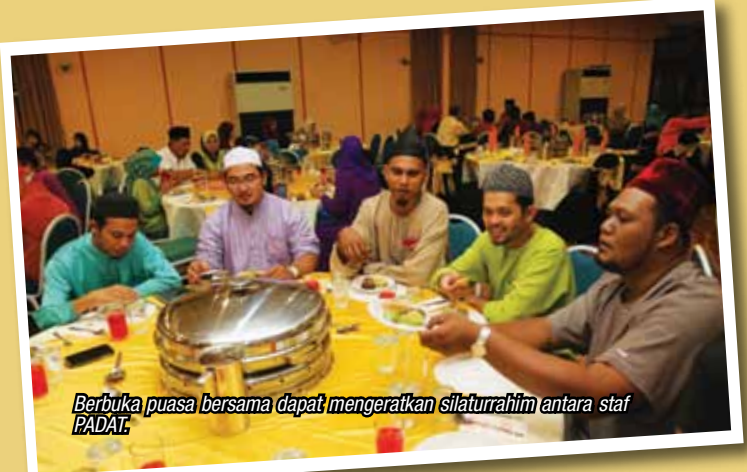
Berbuka puasa bersama dapat mengeratkan silaturrahim antara staf PADAT.

Istimewanya tahun ini, pihak jawatankuasa kelab bersama beberapa orang ahli bertungkus-lumus membuat dan mengacau dua kawah dodol. Proses membuat dan mengacau