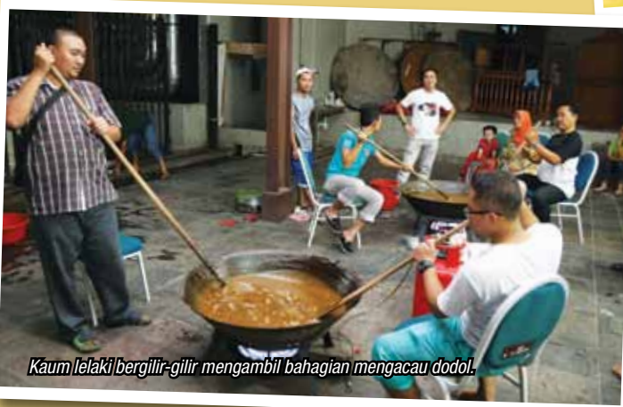
Kaum lelaki bergilir-gilir mengambil bahagian mengacau dodol.

dodol bermula dari jam 11.00 malam dan berakhir pada jam 8.00 pagi. Seorang pakar membuat dodol mengajar staf seterusnya mengepalai proses membuat dodol. Selepas siap dimasak, kesemua dodol dibungkus ke dalam bekas kecil untuk diagihkan kepada semua kakitangan PADAT. Alhamdulillah, dodol yang dibuat menepati citarasa semua dan staf yang terlibat gembira dengan pengalaman baru.