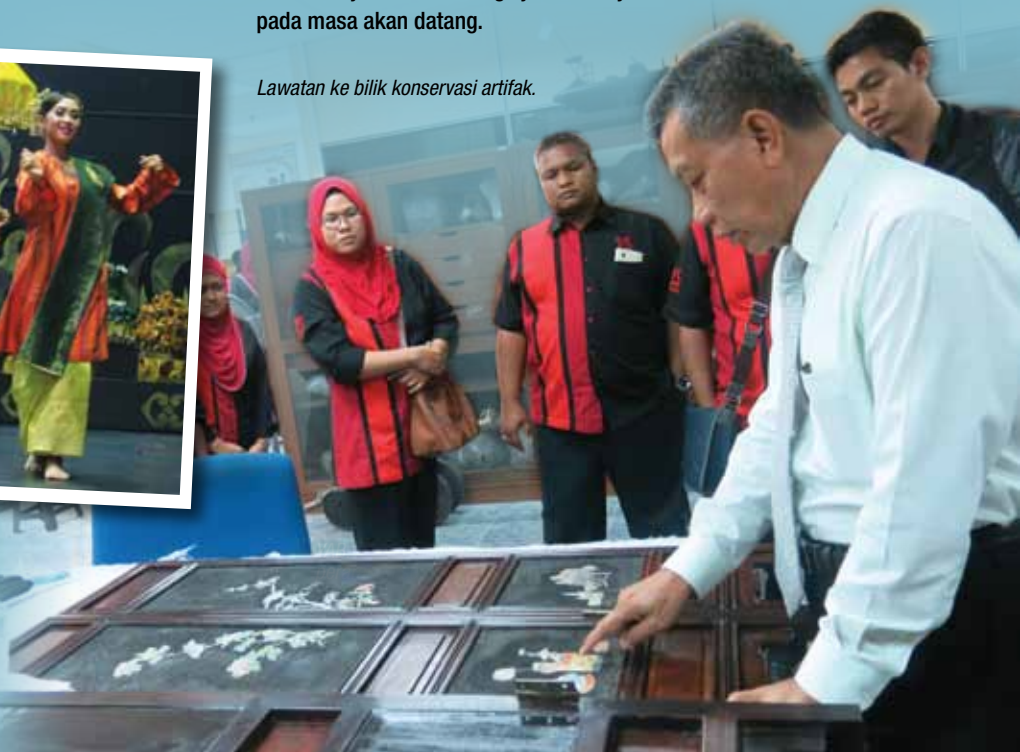
Lawatan ke bilik konservasi artifak.

Seharusnya, program seperti ini hendaklah diteruskan pada masa akan datang. Hal ini kerana, dapat memberi manfaat yang berguna kepada staf PADAT dan sekali gus dapat memberi impak yang baik kepada pembangunan muzium di negeri Selangor. Penghargaan terima kasih kepada pihak muzium yang terlibat kerana telah memberi layanan yang baik sepanjang program lawatan dijalankan. Semoga jalinan kerjasama ini akan berterusan pada masa akan datang.