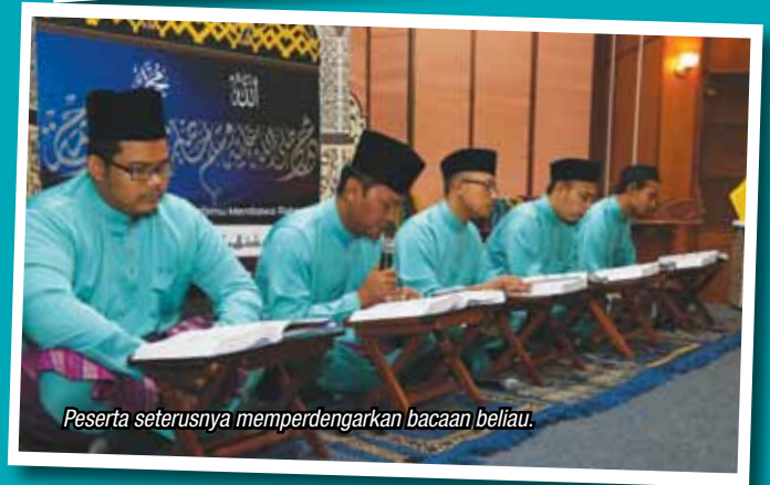
Peserta seterusnya memperdengarkan bacaan beliau.