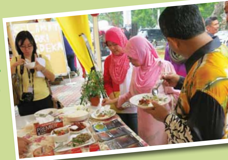
YB Datuk Hajah Norpipah bt Abdol, Timbalan Exco Pembangunan Belia dan Warisan Negeri Melaka mencuba hidangan.

Kerajaan Negeri Melaka melalui Perbadanan Muzium Melaka (PERZIM) dengan kerjasama Pejabat Kementerian Pelancongan dan Kebudayaan Negeri Melaka telah menganjurkan Program Citarasa Malaysia sempena Tahun Melawat Malaysia 2014 pada 12-14 September 2014 yang bertempat di sepanjang Jalan Kota, Kompleks Warisan Melaka. Program ini bertujuan untuk memperkenalkan pelbagai masakan dari seluruh Malaysia selaras dengan pengiktirafan yang diberikan oleh pihak UNESCO selain daripada merapatkan hubungan antara PERZIM dan muzium-muzium lain serta jabatan yang terlibat dalam program ini. Pihak jabatan telah menghantar wakil seramai tujuh orang dengan menghadirkan menu tradisi masyarakat Jawa seperti kuih naga sari, kuih khetewel, kuih kacang, kuih torak, sambal taun, kacang tolo, sambal goreng Jawa, bubur sum-sum, pecal dan mi Jawa. Semua menu tersebut mendapat sambutan dari orang ramai terutama pelancong luar negara.