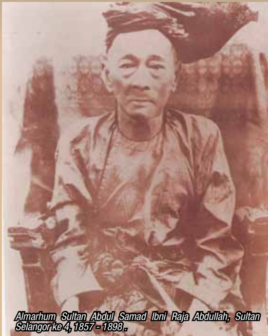
Almarhum Sultan Abdul Samad Ibni Raja Abdullah, Sultan Selangor ke 4, 1857 - 1898.

“..... the Sultan’s interest in revenue matters, in the succession to the throne, in the adjustment of the state boundary between Selangor and Sungei Ujong, in the State debts incurred during the civil war, in health matters, in rebuilding his Istana on the move from Bandar Langat to Jugra, in review of court decisions and the grant of pardons, in the issue of authority (kuasa) to Malay heads of local communities, in loans both to Malay settlers and to Chinese miners, in the proceedings of the State Council which were reported to the Sultan for approval, in the grant of pensions and allowances to Malay Rajas (on which the Sultan was usually a restraining influence), in the abolition of debt slavery, in religious affairs such as the building of mosques and the appointment of Imams, in the conduct of members of his family and in agricultural development and the introduction of new crops”.