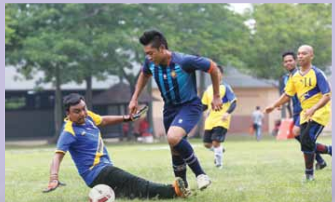
Aksi yang sempat dirakam oleh lensa kamera