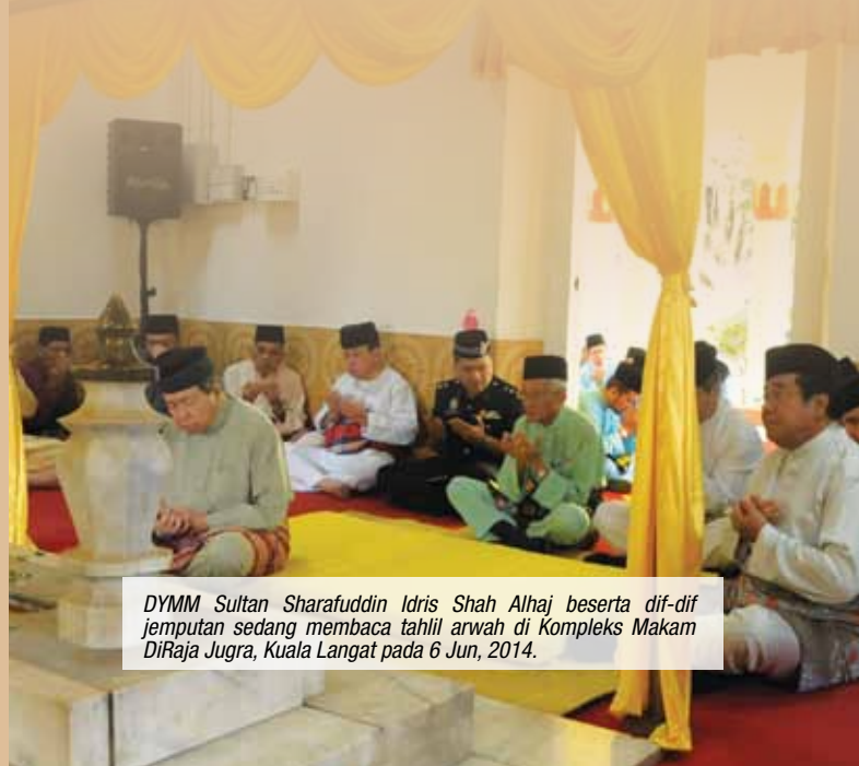
DYMM Sultan Sharafuddin Idris Shah Alhaj beserta dif-dif jemputan sedang membaca tahlil arwah di Kompleks Makam DiRaja Jugra, Kuala Langat pada 6 Jun, 2014.