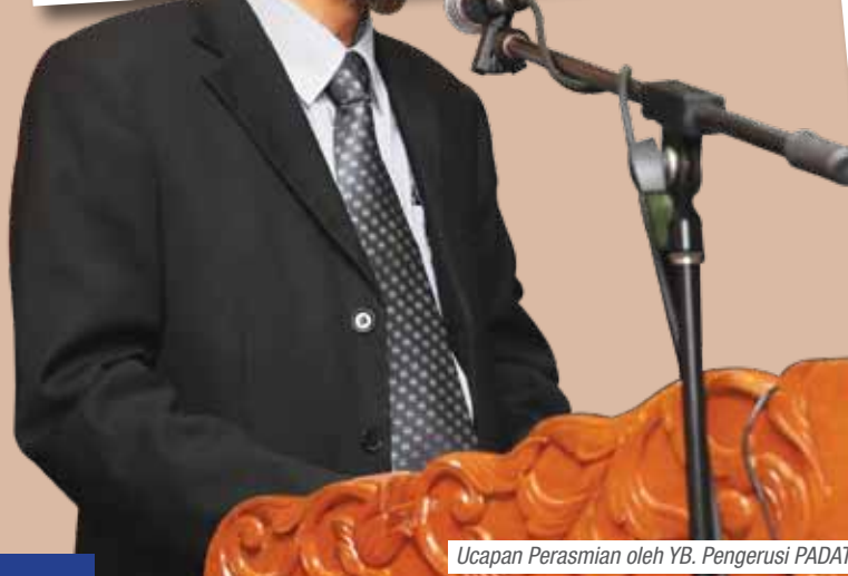
Ucapan Perasmian oleh YB. Pengerusi PADAT.