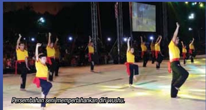
Persembahan seni mempertahankan diri wushu.