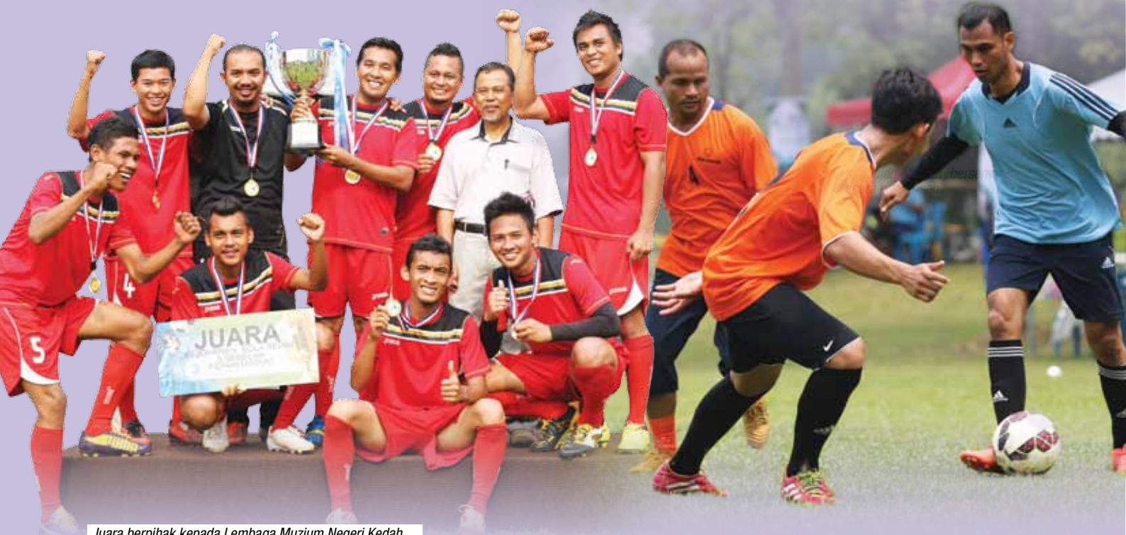
Juara berpihak kepada Lembaga Muzium Negeri Kedah.