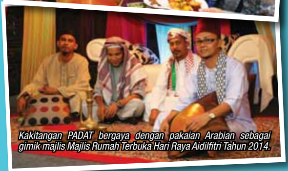
Kakitangan PADAT bergaya dengan pakaian Arabian sebagai gimik majlis Majlis Rumah Terbuka Hari Raya Aidilfitri Tahun 2014.