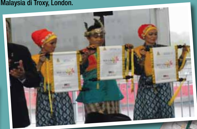
Artis Budaya Kumpulan Kesenian PADAT selaku pembawa skrol sempena sidang media pengisytiharan Tahun Melawat Selangor 2015 bertempat di ExCel, London.

Artis Budaya Kumpulan Kesenian PADAT juga telah bertindak selaku pembawa skrol pengisytiharaan Tahun Melawat Selangor 2015 bertempat di ExCel, London di mana sidang media telah diadakan. Penglibatan Kumpulan Kesenian PADAT turut berjaya menarik minat pihak Tourism Malaysia menggunakan khidmat Artis Budaya yang terlibat sebagai penyambut tetamu dan membuat persembahan sempena Malam Malaysia anjuran Kementerian Pelancongan Malaysia di Troxy, London.