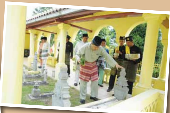
DYMM Sultan Sharafuddin Idris Shah Alhaj sedang menabur bunga rampai di atas makam kerabat diraja di Makam DiRaja Jugra, Kuala Langat pada 6 Jun, 2014.

pengembara di samping komuniti asal yang akhirnya membentuk satu entiti politik menerusi pegangan kuasa-kuasa tertentu. Entiti politik ini seterusnya menjadi sebahagian daripada 'negeri Selangor dan jajahan takluknya' kekal sehingga hari ini.