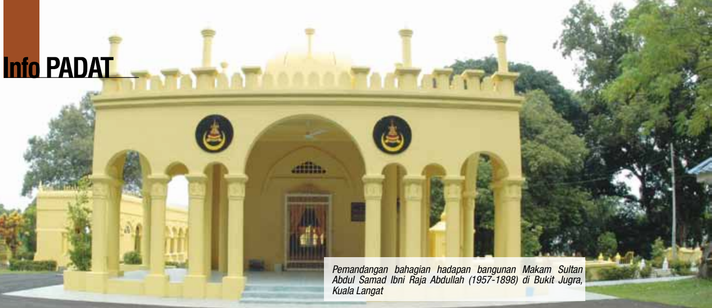
Pemandangan bahagian hadapan bangunan Makam Sultan Abdul Samad Ibni Raja Abdullah (1957-1898) di Bukit Jugra, Kuala Langat