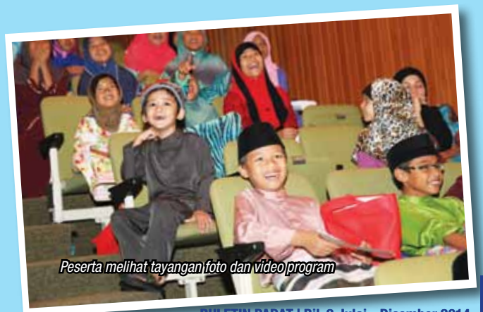
Peserta melihat tayangan foto dan video program

Dengan adanya program seperti ini diharapkan akan memberi impak yang baik dalam mendidik anak-anak menyeimbangkan rohani dan jasmani dalam pembentukan akhlak Rasulullah S.A.W.