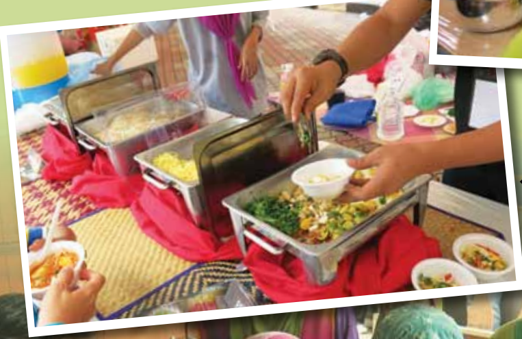
← Masakan Mi Jawa dihidangkan kepada pengunjung.