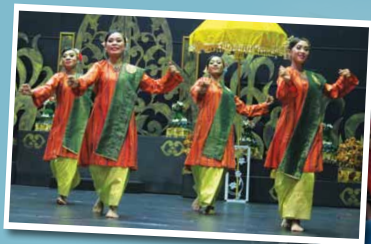
Persembahan zapin daripada Yayasan Warisan Johor.