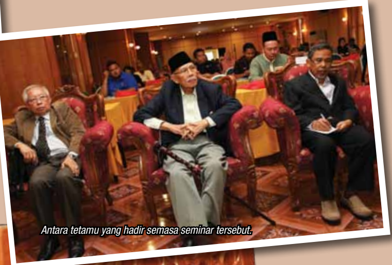
Antara tetamu yang hadir semasa seminar tersebut.