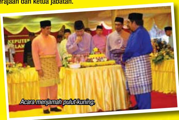
Acara menjamah pulut kuning.

Pada 11 Disember 2014 iaitu pada hari khamis telah diadakan satu lagi Majlis Jamuan Teh DiRaja sempena Hari Keputeraan D.Y.M.M Sultan Selangor yang ke-69 di Padang Mahkota Istana Alam Shah, Klang yang dikelolakan oleh Orang Besar Daerah Klang. Kehadiran jempunan seramai 2,000 orang. Majlis telah diraikan dengan sambutan Seni Silat Serantih, pembawa sireh junjung dan bunga emas, pemegang bunga manggar, Kumpulan Pergendangan Pelbagai Kaum (Gendang Selangor, Gendang Sembilan, Gendang Cina, Gendang Bangra). Terdapat juga persembahan tarian daripada Kumpulan Kesenian Perbadanan Adat Melayu dan Warisan Negeri Selangor (PADAT), Kombo Gelombang Biru dan pancaragam daripada Tentera Laut Diraja Malaysia. Pada ulangtahun Keputeraan ke-69 D.Y.M.M Sultan Selangor, turut diadakan acara menjamah pulut kuning dan majlis mengadap untuk para tetamu bersalam-salaman bersama D.Y.M.M Sultan Selangor dan majlis berakhir pada jam 5.30 petang.