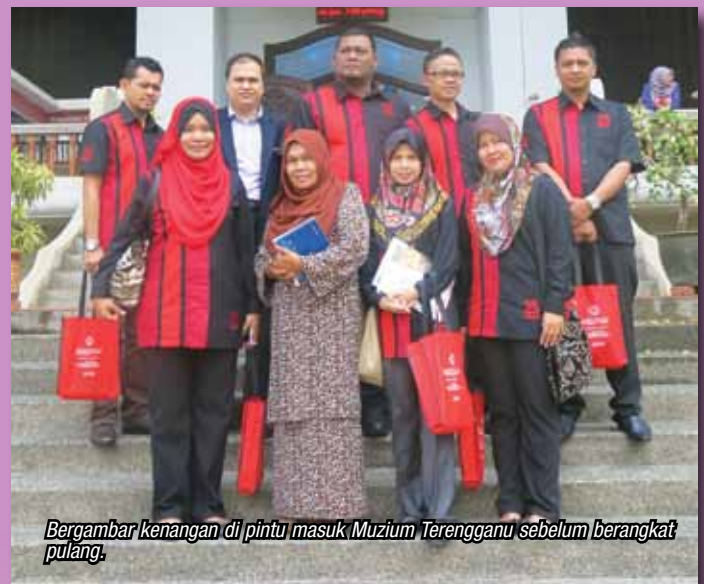
Bergambar kenangan di pintu masuk Muzium Terengganu sebelum berangkat pulang.

Hasilnya, kami mengetahui perbezaan memperagakan pameran dan mempelajari cara membezakan kraftangan yang dihasilkan melalui kaedah tradisional dan moden seperti batik dan tembaga.