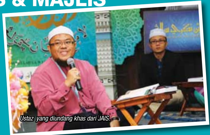
Ustaz yang diundang khas dari JAIS.

Setelah kesemua juzuk habis dibaca, majlis khatam al-Quran telah diadakan. Majlis ini berlangsung pada 18 Julai 2014 bersamaan 20 Ramadhan 1435 Hijrah. Seramai 5 orang staf lelaki telah dipilih untuk memperdengarkan bacaan surah lazim dan disemak oleh pegawai yang diundang khas dari Jabatan Agama Islam Selangor. KRKLMS menyampaikan cenderamata kepada semua kakitangan yang terlibat dalam program tadarus ini. Alhamdulillah, majlis berjalan dengan lancar dan mendapat sokongan penuh daripada pihak pengurusan PADAT. Semoga program ini dapat diteruskan lagi pada Ramadhan akan datang. Insyallah.