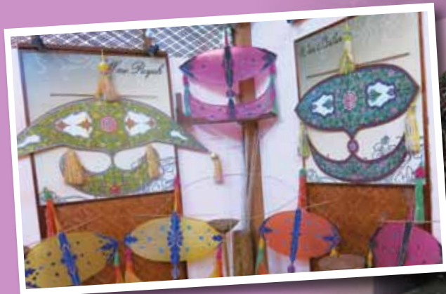
Susun atur wau-wau yang dipamerkan secara terbuka kepada pengunjung.