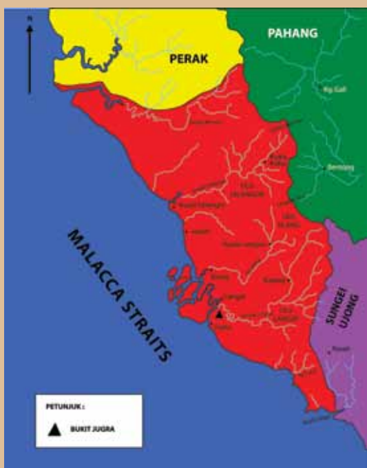
Peta Selangor pada tahun 1870.

Sewaktu Sultan Abdul Samad memerintah di Jugra, baginda telah mewakafkan kawasan di Bukit Jugra dan sekitarnya sebagai kawasan perkamaman. Kawasan Makam DiRaja Jugra merupakan sebahagian dari Bukit Jugra yang telah dipilih sebagai kawasan perkamaman keluarga DiRaja Selangor semenjak tahun 1880. Kawasan ini juga dikenali sebagai Kompleks Makam DiRaja Jugra dan secara keseluruhannya kawasan perkamaman ini dikawal dan berpagar serta berkeluasan lima ekar. Kawasan Kompleks Makam DiRaja Jugra boleh dikunjungi oleh para pelawat dengan menggunakan jalan darat dan dilengkapi dengan pelbagai kemudahan. Sebagaimana pusara bagi orang kebanyakan yang sentiasa dikunjungi oleh kaum keluarga, makam DiRaja ini juga sentiasa dikunjungi oleh kaum kerabat DiRaja. Di Kompleks Makam Diraja ini terdapat sebuah bangunan khusus yang menempatkan Makam Sultan Abdul Samad Ibni Raja Abdullah yang memerintah pada tahun 1857 dan mangkat pada 06 Februari, 1898 (14 Ramadhan 1315 Hijrah) ketika berusia 93 tahun. Baginda mangkat di Istana Jugra, Kuala Langat. Jenazah baginda telah disemadikan di atas Bukit Jugra, Kuala Langat dengan jagaan yang rapi dan sentiasa dipelihara. Almarhum jugra dikenali sebagai 'Marhum Jugra'.