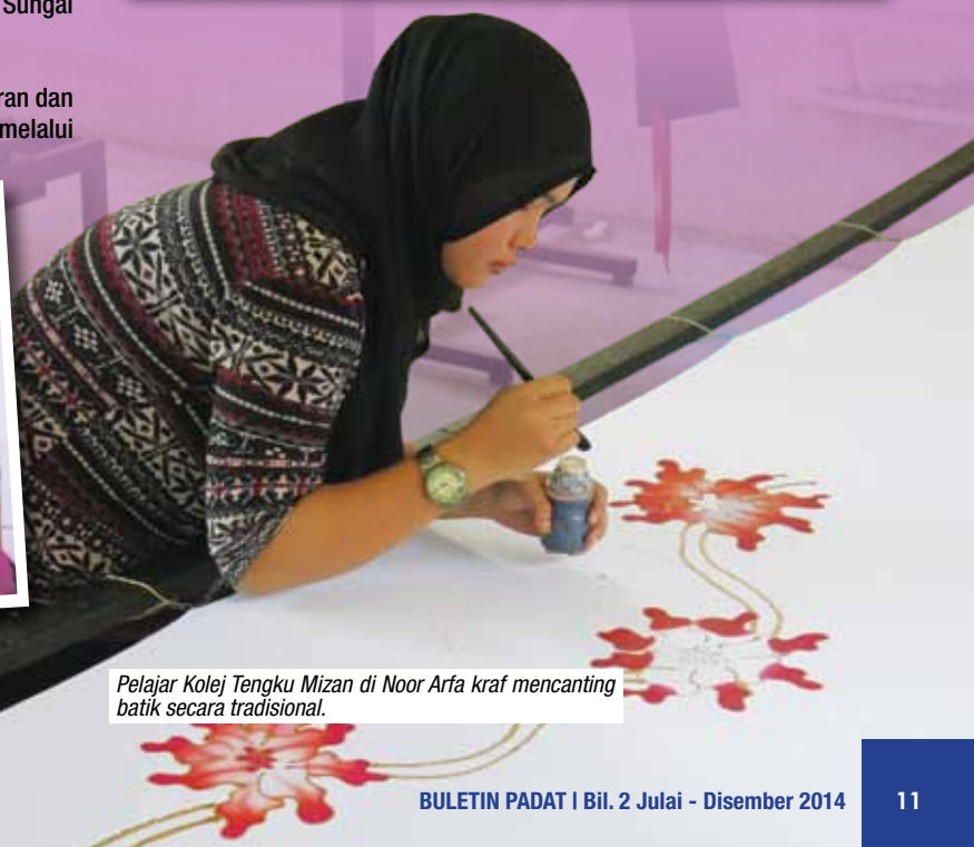
Pelajar Kolej Tengku Mizan di Noor Arfa kraf mencanting batik secara tradisional.