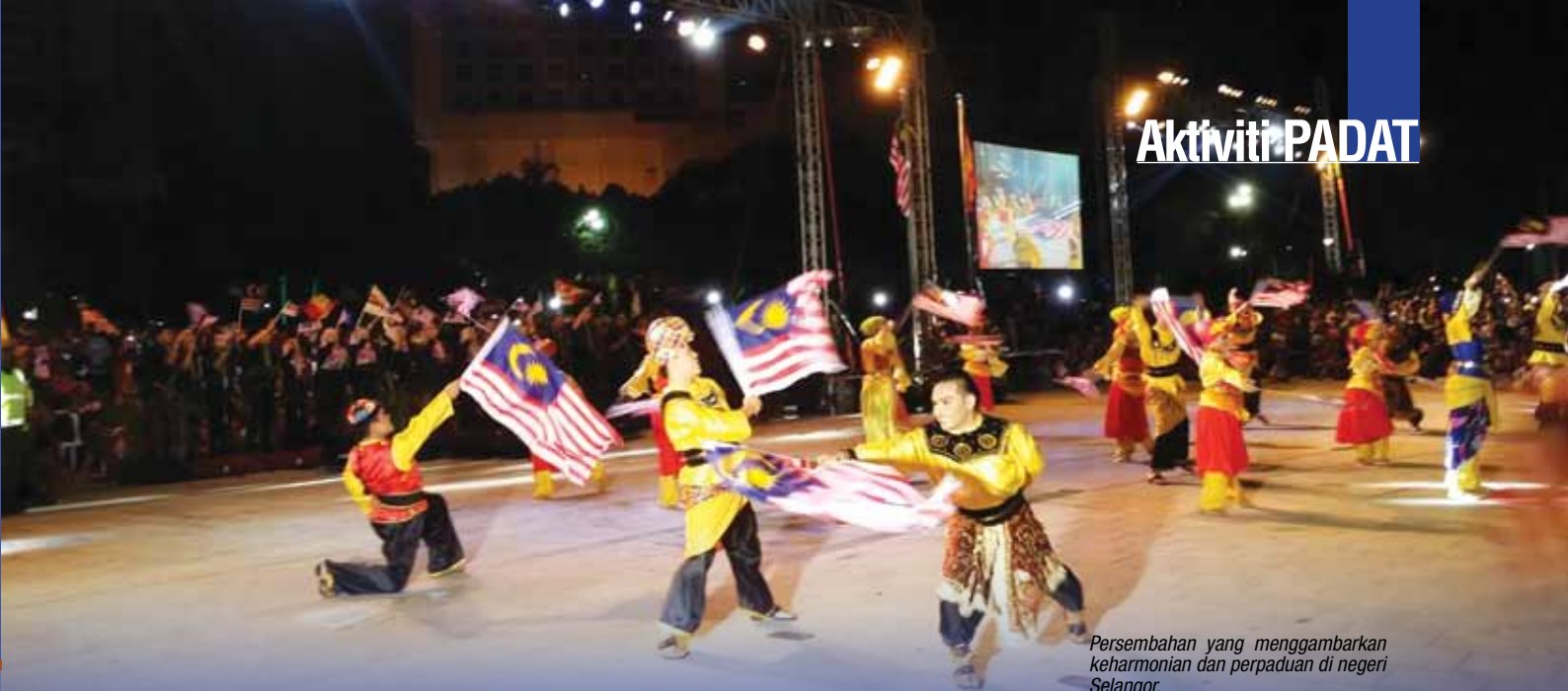
Persembahan yang menggambarkan keharmonian dan perpaduan di negeri Selangor.