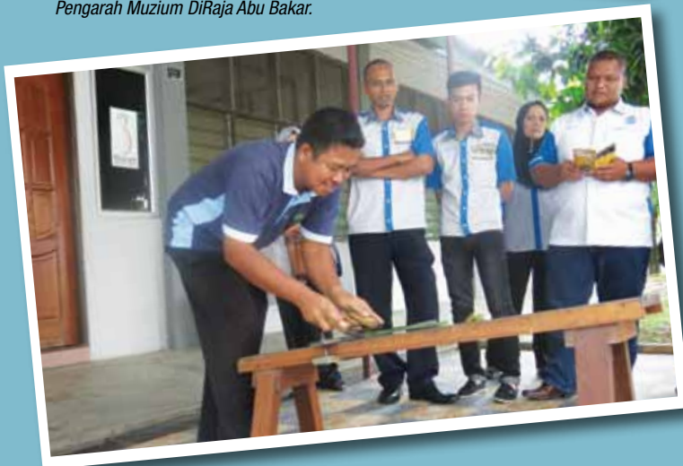
Lawatan ke Jabatan Pertanian (Muzium Nanas), teknik membuat tali daripada daun nanas.