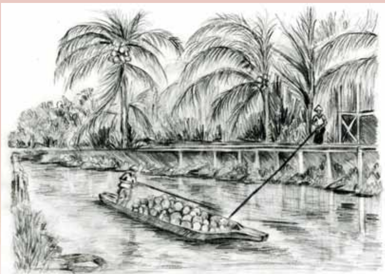
Ilustrasi cara-cara perahu jalur/perahu sebatang ini dikendalikan untuk membawa komoditi pertanian.

perahu tersebut dari darat ke baruh (dari kawasan lebih tinggi hingga ke kawasan atau tanah yang lebih rendah letaknya seperti berdekatan pantai).