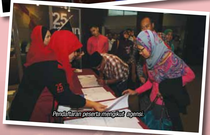
Pendaftaran peserta mengikut agensi.

Sebahagian peserta yang hadir memakai pakaian tradisional yang melambangkan zaman Kesultanan Melayu.