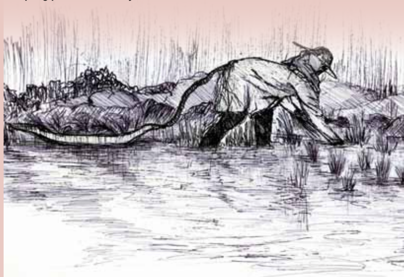
Ilustrasi cara-cara perahu jalur/perahu sebatang ini dikendalikan oleh pesawah untuk membawa anak pokok padi untuk disemai.

Pengamatan terhadap perahu jalur ini dapat dilihat juga dari segi saiz dan teknologi pembuatannya. Selain ditarik dari sebatang pokok, ia juga dapat ditinjau dari aspek penggunaan sumber alam sebagai penyokong. Adalah disebabkan fizikal dan bentuknya yang amat kecil dengan ketinggian yang amat rendah, hanya membataskan penggunaannya di tali air dan sungai-sungai kecil di kampung-kampung pedalaman sahaja.