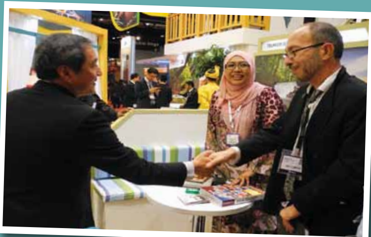
Antara barangan promosi negeri Selangor yang dibawa.