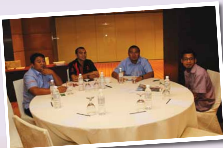
Staf sedang mendengar sesi taklimat.

Pada hari terakhir bengkel tersebut, Ketua Pegawai Eksekutif PADAT, telah menegaskan perlunya semua pegawai yang terlibat memberi fokus dan komitmen dalam memastikan semua program, aktiviti dan projek yang telah dirancang dapat dilaksanakan dengan cemerlang dan dapat dimanfaatkan oleh golongan sasar serta menepati kehendak kerajaan negeri.