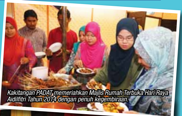
Kakitangan PADAT memeriahkan Majlis Rumah Terbuka Hari Raya Aidilfitri Tahun 2014 dengan penuh kegembiraan.

Dengan tema "Arabian" yang dipilih bagi hiasan dewan dan pakaian kakitangan PADAT telah menampilkan kelainan kepada Majlis Rumah Terbuka Hari Raya Aidilfitri Tahun 2014. Pada majlis tersebut Kelab Kebajikan dan Rekreasi Lembaga Muzium Selangor dengan berbesar hati telah menyumbangkan duit raya untuk semua ahli kelab sebagai tanda terima kasih kepada semua ahli kelab selain menyampaikan hadiah hari kelahiran kepada semua ahli kelab yang juga kakitangan PADAT. Diharapkan dengan adanya Majlis Rumah Terbuka Hari Raya Aidilfitri ini dapat merapatkan ukhwah persaudaraan antara kakitangan PADAT.