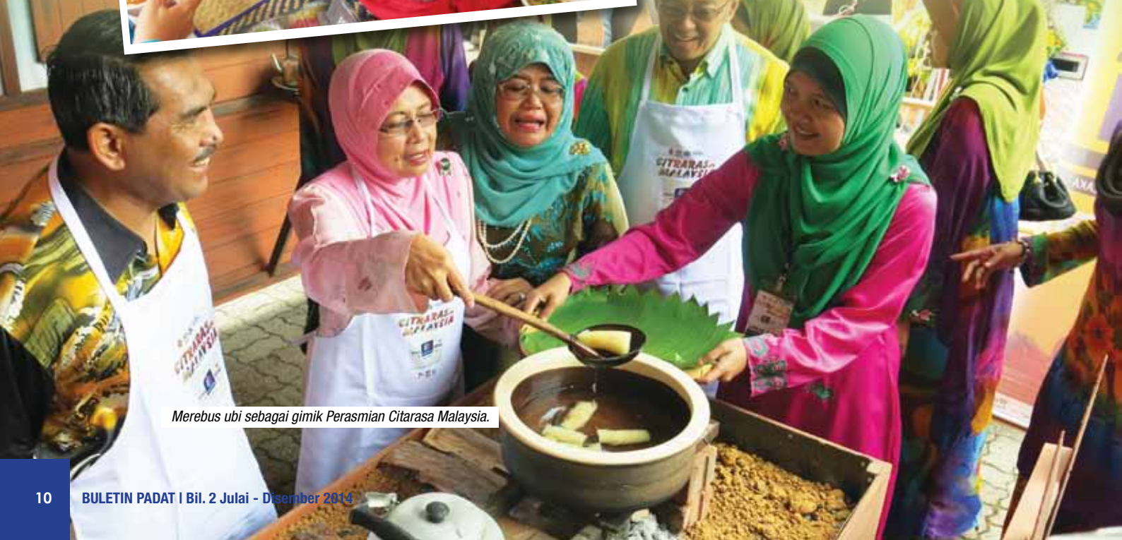
Merebus ubi sebagai gimik Perasmian Citarasa Malaysia.