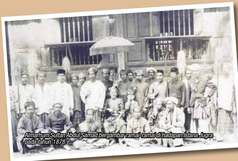
Almarhum Sultan Abdul Samad bergambar ramai-ramai di hadapan Istana Jugra pada tahun 1878.